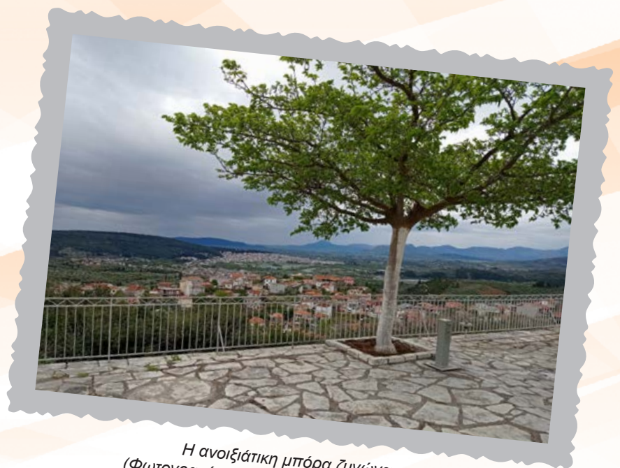
Η ανοιξιότικη μπόρα ζυγώνει (Φωτογραφία από το ύψωμα του Μνημείου).