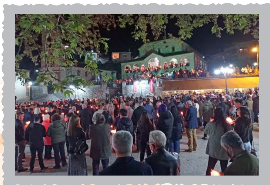
Ανάσταση την πρώτη χρονιά απόσυρσης των σκληρών περιοριστικών μέτρων.