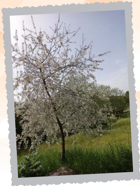
Σκιρτήματα της Άνοιξης στο χωριό.