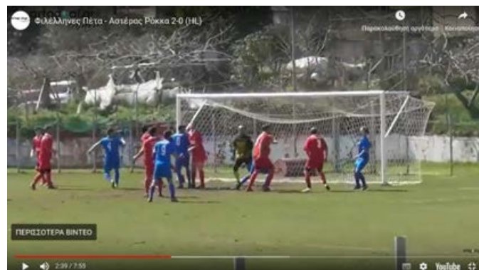
Στιγμιότυπο από τον αγώνα Φιλέλληνες Πέτα - Αστέρας Ρόκκα (2-0)

Η προμήθεια των απινιδωτών έγινε από τη Δημοτική Αρχή Άρτας η οποία ανέλαβε και την οργάνωση των σεμιναρίων.