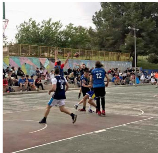
Φωτογραφία από προηγούμενο τουρνουά μπάσκετ

Η Αδελφότητα στηρίζει έμπρακτα απ' την πρώτη στιγμή αυτήν την προσπάθεια και σας καλούμε όλες και όλους να ενισχύσετε την προσπάθεια αυτή, είτε συμμετέχοντας με την ομάδα σας, είτε απ' την πλευρά του θεατή!