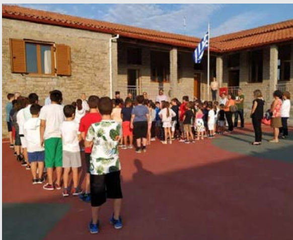
Έναρξη σχολικού έτους (Φωτογραφία αρχείου)

Παραθέτουμε την ευχαριστήρια επιστολή του συλλόγου των διδασκόντων.