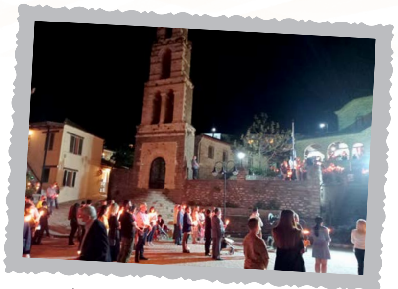
Ανάσταση στην εποχή covid. Ισχνή η παρουσία των συγχωριανών μας.