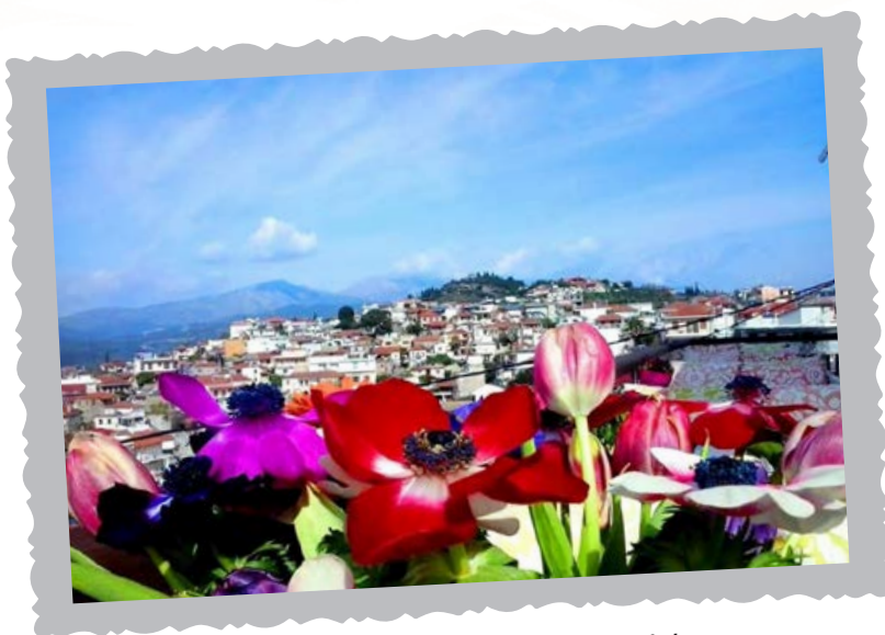
Τα χρώματα της Άνοιξης μας καλούν!