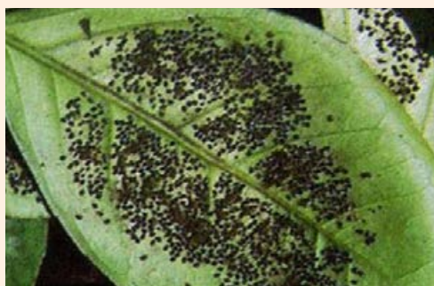
Αποκρουστική αισθητικά και επιβλαβής για τα φυτά η εξάπλωση του Μαύρου Αλευρώδους

Πρόκειται για έντομο που επικάθεται στο κάτω μέρος του φυλλώματος των δέντρων και αναπτύσσεται σε πυκνές αποικίες προνυμφών. Μια κατάμαυρη κολλώδης καπνιά καλύπτει όλο το δέντρο, δημιουργώντας μια αποκρουστική