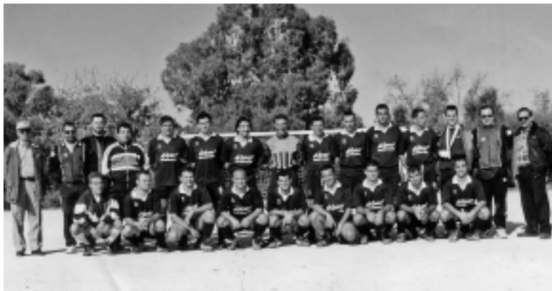
Η ομάδα της Αδελφότητας όπως αγωνίζονταν στο πρωτάθλημα του Εργατικού Κέντρου Αθήνας το 2000, όπου κατέλαβε τη 2η θέση.