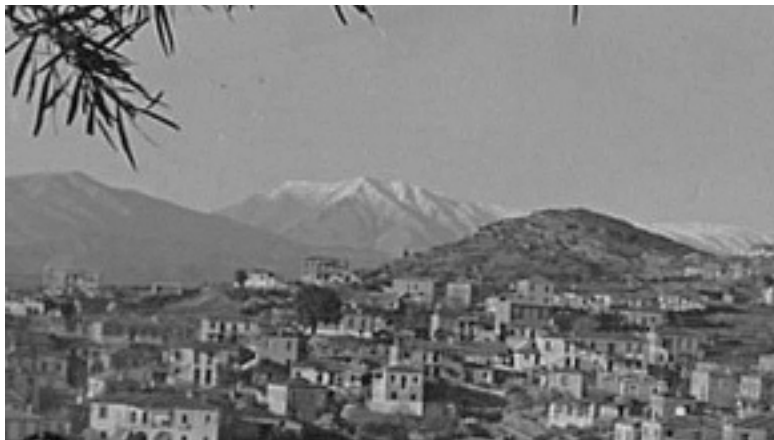
Μερική άποψη του Πέτα με την Κορακοφυλιά και το χιονισμένο Ξηροβούνι (1957)