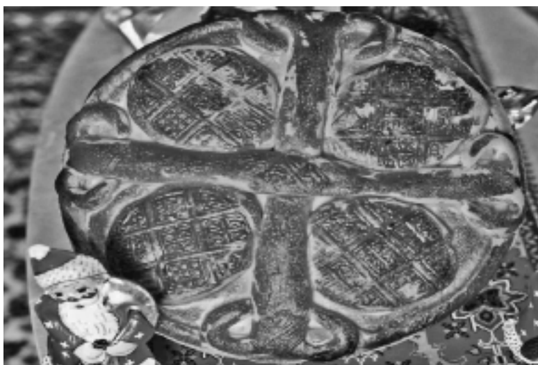
ΧΡΟΝΙΑ ΠΟΛΛΑ ΣΕ ΟΛΟΥΣ Χριστόφωμο της Φούλας Σερβετά, 1990