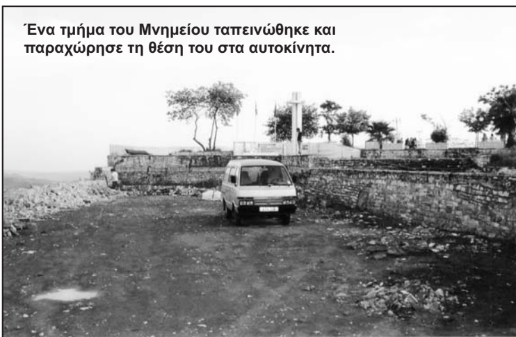
Ένα τμήμα του Μνημείου ταπεινώθηκε και παραχώρησε τη θέση του στα αυτοκίνητα.

βάλλον που συντελείται μπροστά στα μάτια μας, είναι η ανάπτυξη των θηριωδών ορνιθοτροφείων περιφερειακά και πολύ κοντά στο δομημένο χώρο, αφήνοντας ακάλυπτη μόνο τη μπουκά προς τη λίμνη. Η ίδια τους η ύπαρξη συνεπικουρούμενη από την ανυπαρξία μέτρων προστασίας του περιβάλλοντος στο χώρο των επιχειρήσεων ή ακόμη χειρότερα, η αποβολή των λυμμάτων τους, όπου, γουστάρουν, απαζώνουν το σύνολο του καλλιεργημένου και δομημένου χώρου. Στην περίπτωση ύπαρξης μεταδοτικών ασθενειών που απευχόμαστε να συμβεί κάποτε στο μέλλον, ασθενειών που σχετίζονται με τα πουλερικά και τη διαχείρισή τους, όπως ήδη παρατηρήθηκε αλλού, η περιοχή παραμένει εντελώς αθωράκιστη. Ακόμη και η ασφαλτοστρωση κάποιων αγροτικών δρόμων που φαντάζει αναπτυξιακό έργο για το συμφέρον των πολλών, εντέλει σήμερα μπορούμε να ισχυριστούμε πως κατά