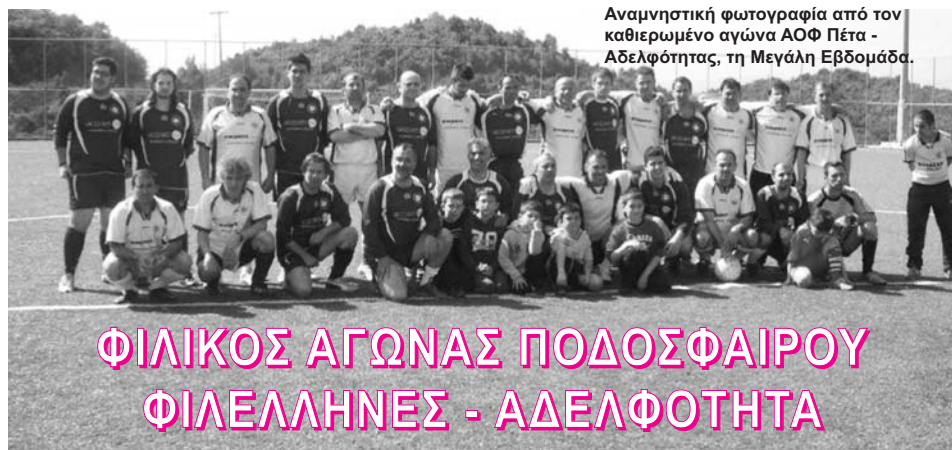
Αναμνηστική φωτογραφία από τον καθιερωμένο αγώνα ΑΟΦ Πέτα - Αδελφότητας, τη Μεγάλη Εβδομάδα.

Θερμά συγχαρητήρια στους ποδοσφαιριστές και τον προπονητή. Συγχαρητήρια στο Δ.Σ. για τη μεγάλη και δύσκολη προσπάθεια. Ευχή όλων του χρόνου να καμαρώσουμε την ομάδα μας στην Α' κατηγορία.