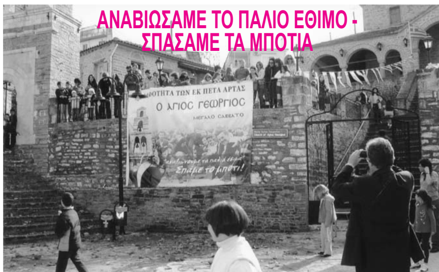
Η εκδήλωση για το σπάσιμο του μπότι, που διοργάνωσε για μια ακόμη χρονιά η Αδελφότητα, είχε μεγάλη συμμετοχή και ήταν επιτυχής. Τα 70 μπότια που πρόσφερε η Αδελφότητα για τις ανάγκες του εθίμου αποδείχτηκαν τελικά λίγα, λόγω της αυξημένης συμμετοχής των -κύρια νέων- συνδημοτών μας.

Για δεύτερη συνεχόμενη χρονιά το Δ.Σ. της Αδελφότητας αναβίωσε ένα παλιό έθιμο των Πετανιτών «το σπάσιμο του μπότι». Το Μεγ. Σάββατο από νωρίς το πρωί τα μέλη του Δ.Σ. ετοιμάσανε την εκδήλωση.