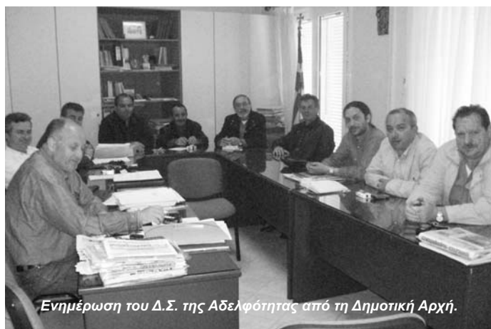
Ενημέρωση του Δ.Σ. της Αδελφότητας από τη Δημοτική Αρχή.

- Δημοπρατήθηκε και βρίσκεται σε εξέλιξη η ανακατασκευή του γηπέδου Πέτα. Το συνολικό του κόστος υπολογίζεται στα 150.000 ευρώ. Από το πρόγραμμα «Θησέας», που στηρίζει δράσεις των δήμων, εξασφαλίστηκαν 45.000 + 24.000 ευρώ για το γηπέδο και τις κερκίδες και τα υπόλοιπα θα δοθούν από τον προϋπολογισμό του Δήμου. Με την ίδια διαδικασία θα δημοπρατηθεί το γηπέδο Αγίου Δημητρίου στη θέση «Γιαλός». Να σημειωθεί ότι ο Δήμος βρίσκεται στα