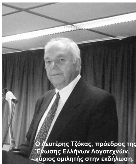
Ο Λευτέρης Τζόκας , πρόεδρος της Ένωσης Ελλήνων Λογοτεχνών, κύριος ομιλητής στην εκδήλωση.

το 1934, η Ένωση Ελλήνων Λογοτεχνών έστριξε με την Εταιρεία Ελλήνων Λογοτεχνών, στην επέτειο της αποφράδας ημέρας, χάρη στην από κοινού ομιλία από τον πρόεδρο Λευτέρη Β. Τζόκα . Ακόμη πρέπει τα λογοτεχνικά σωματεία να ενωθούν σε Ομοσπονδία, ώστε ν' αντιμετωπίσει η ελληνική Λογοτεχνία την παγκόσμια...».