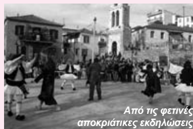
Από τις φεινές αποκριάτικες εκδηλώσεις

Το γαϊτανάκι του Συλλόγου αναβίωσε το παλιό έθιμο στις κάτω γειτονίες του χωριού. Το βραδύ διοργανώθηκε μασκέ πάρτυ στο café-bar CINEMA (Α. Αγγέλη), ένα πάρτυ που κράτησε μέχρι πρωίας.