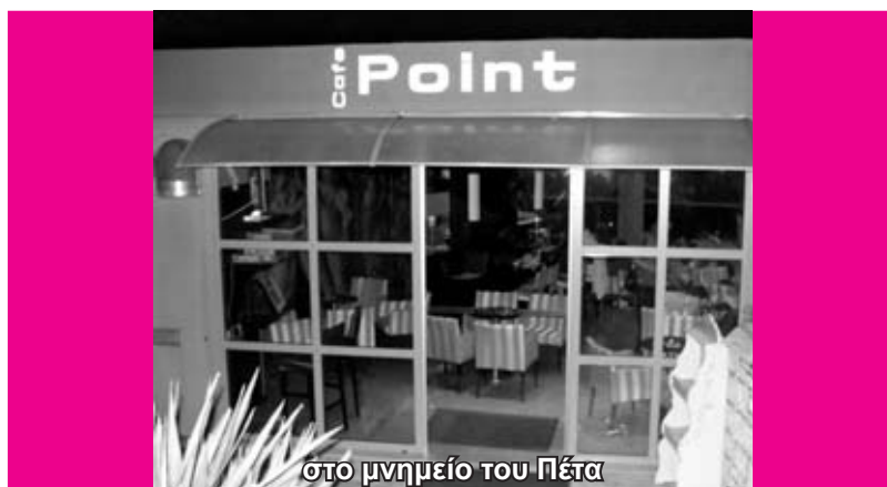
στο μνημείο του Πέτα

Τηλέφωνα επικοινωνίας: 2681083474 - 82063