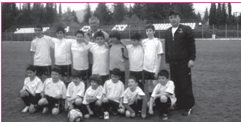
Η Περαινή σύνθεση της παιδικής ομάδας του συλλόγου μας.

Το βιβλίο κυκλοφόρησε από τις εκδόσεις Μεταίχμιο και υπάρχει η δυνατότητα ηλεκτρονικής ανάγνωσης αποσπασμάτων στη διεύθυνση: http://www.metaixmio.gr/images/flip/ouranopetra/index.html , ενώ στη διεύθυνση: http://www.youtube.com/watch?v=VLlPkwW61o0 υπάρχει βίντεο που αναφέρεται στο περιεχόμενο του βιβλίου.