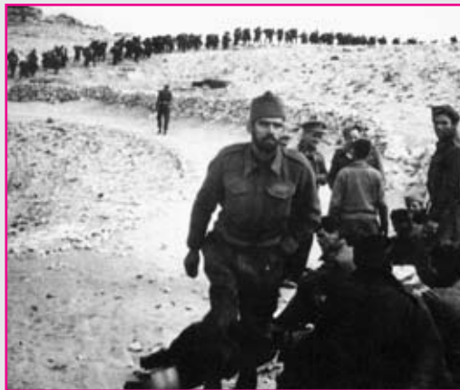
Πορεία στο μέτωπο το 1940. Ακολούθησε η Εθνική Αντίσταση και ο εμφύλιος

Έτσι αντί για ένα ελαφρό τάγμα πεζικού, οι αντάρτες του Κ.Γ.Α.Ν.Ε. βρήκαν μπροστά τους, στις 20-21 Μαρτίου που άρχισαν οι συγκρούσεις, δύο ταξιαρχίες του Κυβερνητικού Στρατού που ενισχύονταν συνεχώς με νέες ξεκούραστες μονάδες.