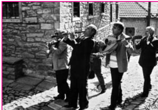
Τα όργανα του γάμου

Μ' έχουν τρελό τα κάλλη σου όμορφη χαϊδεμένη