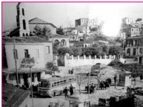
Μια φωτογραφία χίλιες λέξεις!