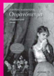
Το εξώφυλλο από το νέο μυθιστόρημα του Γιάννη Καλπούζου

Δώδεκα γενιές αργότερα ένας απόγονός του πορεύεται με βάση τη θεωρία του: όπου πατώ είναι δικός μου δρόμος. Το βιβλίο περιδιαβαίνει σε Κύπρο, Αθήνα, Θεσσαλία, Ήπειρο και πάνω απ' όλα στον συμπαντικό χάρτη της ψυχής, εξιστορώντας μέσα από την πολυεπίπεδη ματιά του συγγραφέα, την αναγνωστική ευφορία και τους ολοζώντανους χαρακτήρες, τη ζωή των αφανών που απάνω τους πατούμε.