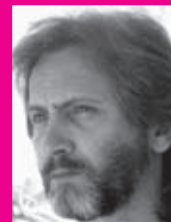
Ο συγγραφέας Γιάννης Καλπούζος

Πριν λίγες μέρες επανήλθε με το νέο του μυθιστόρημα «Ουρανόπετρα. Η δωδέκατη γενιά».