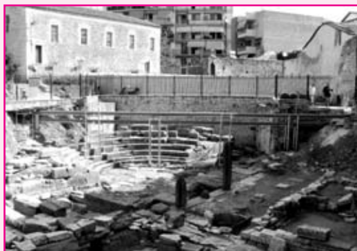
Το «Μικρό Θεατράκι»

Το έργο «Ανάδειξη - ενοποίηση αρχαιολογικών χώρων αρχαίας Αμβρακίας: Δυτική Νεκρόπολη - Ναός Απόλλωνα - Μικρό Θέατρο», που χρηματοδοτείται από το ΕΣΠΑ, εξελίσσεται με ικανοποιητικούς ρυθμούς. Αναλυτικότερα, κύριος στόχος του έργου είναι η ανάδειξη των τριών σημαντικών αρ-