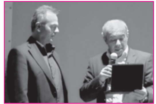
Τιμητική πλακέτα στον Α.Ο.Φ. Πέτα για τη συνεισφορά του στον Πολιτισμό

Η ομάδα μας βρίσκεται στην 7η θέση με 20 βαθμούς έχοντας 6 νίκες, 9 ήττες και 2 ισοπαλίες.