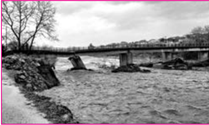
Η γέφυρα από το Κομποτί στο γήπεδο κατέρρευσε

Μ εγάλες ήταν οι ζημιές που προκάλεσαν οι πλημμύρες και στο Δήμο Ν. Σκουφά. Οι πλημμύρες έπληξαν την περιοχή Κομποτίου, κύρια από τους τοπικούς χειμάρρους. Μάλιστα, γκρεμίστηκε και η γέφυρα που συνδέει το Κομποτί με την περιοχή του γηπέδου.