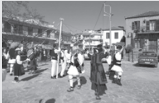
Το γαϊτανάκι εν δράσει στην πλατεία του χωριού

Την Κυριακή της Αποκριάς το γαϊτανάκι χόρεψε σε όλες τις γειτονιές της πάνω πλευράς του Πέτα. Δυστυχώς, η παρέλαση των γκρουπ που