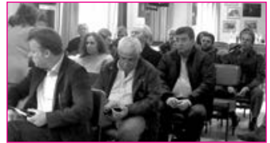
Από την εκлого-απολογιστική συνέλευση της Αδελφότητας

γωνίστρια της ταινίας Με τη Λάμψη στα Μάτια, που γυρίστηκε στο Πέτα.