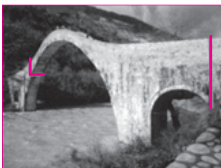
Οι υπεύθυνοι ολιγόωρησαν στις υποδείξεις για τις ρωγμές στο γεφύρι της Πλάκας

Η Αδελφότητα σε ανακοίνωσή της, που δημοσιεύτηκε στο προηγούμενο φύλλο της εφημερίδας μας, τοποθετήθηκε σθεναρά ενάντια σ' αυτή την προοπτική.