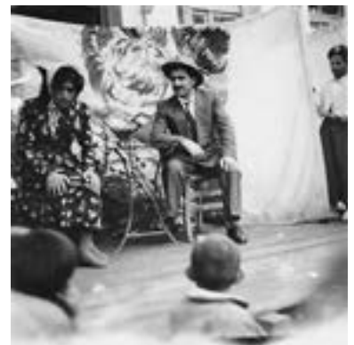
1956. Θεατρική παράσταση στην πλατεία του Πέτα